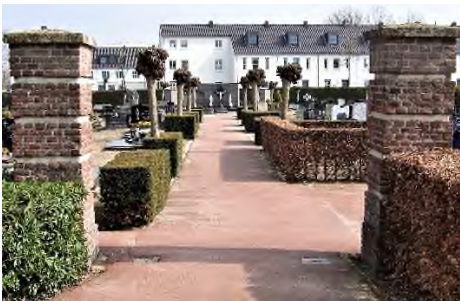
Nuenen - Clemenskerkhof