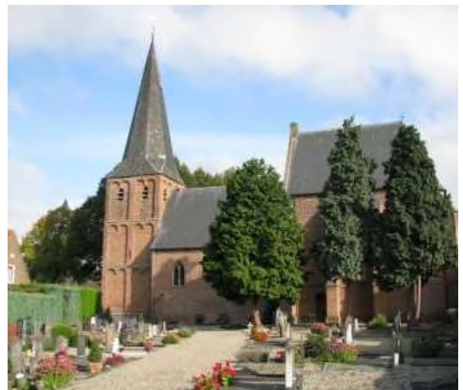
Driel - protestantse kerk en kerkhof

Op 9 juli 1885 is bij besluit van burgemeester en wethouders van Nuenen de Adriaan Rijkenstraat vastgesteld met als ondertekst: Nuenense wever, schildersmodel Vincent van Gogh.