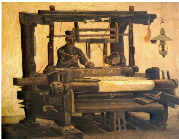
Wever van voren gezien (1884)