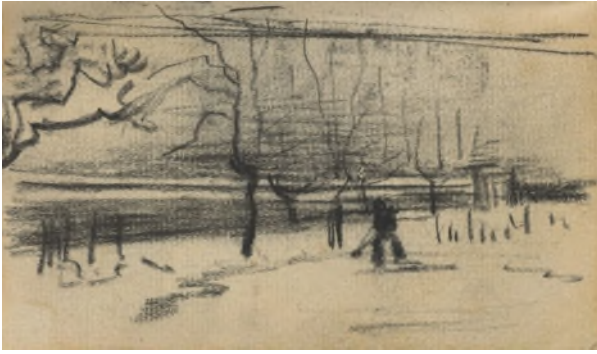
De pastorietaan in de sneeuw (1885)