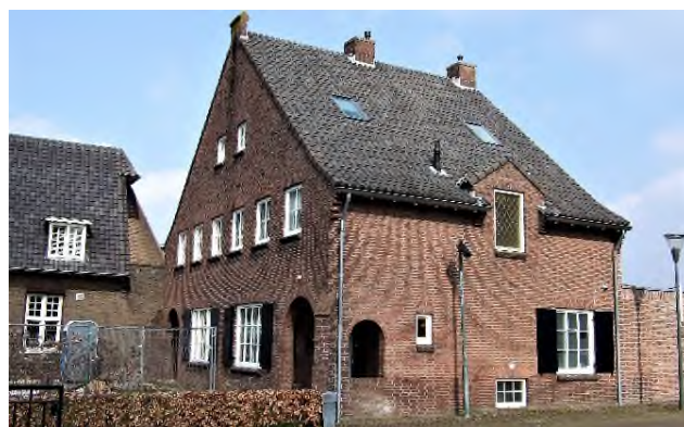
huidige dubbele woning