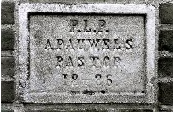
P.L.P.: Primus Lapis Positus = eerste steen gelegd

een Smits-orgel plaatsen. In de jaren 1885 tot 1887 zorgt hij dat er voor de zusters van de congregatie J.M.J. (Zusters van de Sociëteit van Jezus, Maria en Jozef uit den Bosch) een klooster, het Sint-Elisabethgesticht, wordt gebouwd. Op 10 mei 1886 legt hij de eerste steen en zegent, na oplevering, de kapel en de nieuwe kruiswegstaties.