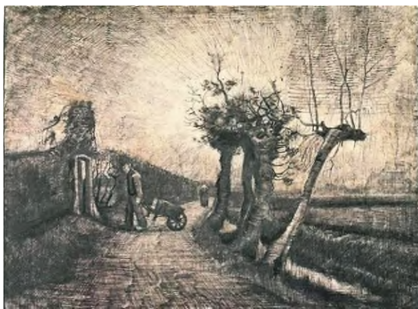
Achter de heggen (1884)