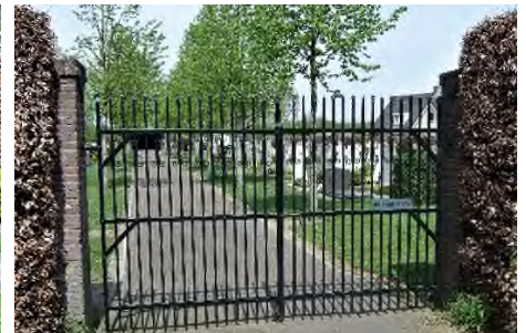
Gerwen - De Huikert