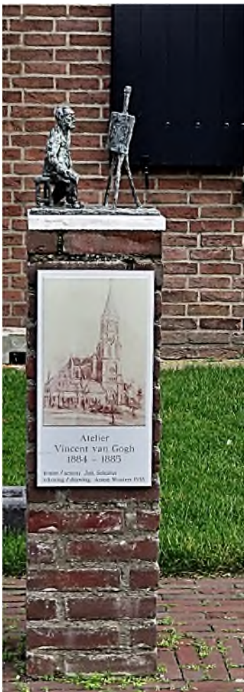
zuil met plastiek (2015) van Peter Nagelkerke voor het voormalige atelier

waaronder mossen, vogelnesten, dooie dieren. Ja wat al niet? Regelmatig kuisen doet hij zijn vertrekken nauwelijks.