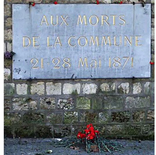
Père Lachaise - Mur des Fédérés

Julien Tanguy wist te ontkomen, maar werd later gearresteerd, voor een krijgsraad gebracht, veroordeeld en gevangen gezet. Na twee jaar internering werd hem gratie verleend.